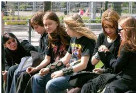
W grupie zawsze różniej