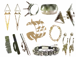
tu coś dla miłośniczki biżuterii