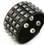
to raczej dla chłopaka