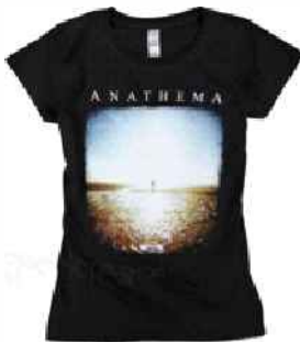
coś dla chłopaków