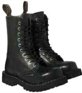
glany są niezawodne

Bardzo popularny wśród młodzieży jest styl rockowy. A jak powinien wyglądać prawdziwy rockowy ubiór? Oto kilka rzeczy, bez których się nie obejdzie.