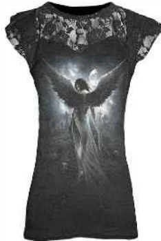
coś dla dziewczyn